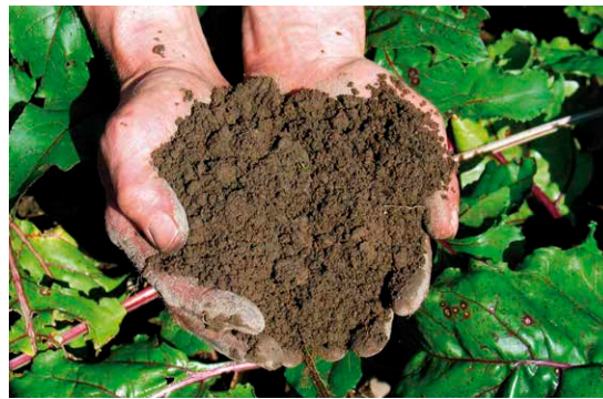
Das Element Erde steht für die Fähigkeit, aus Erfahrungen zu lernen.

H immel und Erde, Mensch und Natur – alles, so lehrt das Tao, ist von wuxing bestimmt, den fünf Wandlungsphasen oder Elementen Holz, Feuer, Erde, Metall und Wasser. Unserer westlichen Denkweise scheint die Idee der Wandlungsphasen und des sich unentwegt verändernden Qi zunächst fremd, stellt sie doch ein sehr abstraktes System von Entsprechungen dar. Das Konzept der fünf Elemente beschreibt alle Phänomene des Lebens und arrangiert sie zu einem immer neuen, veränderlichen Gesamtbild, das nie in