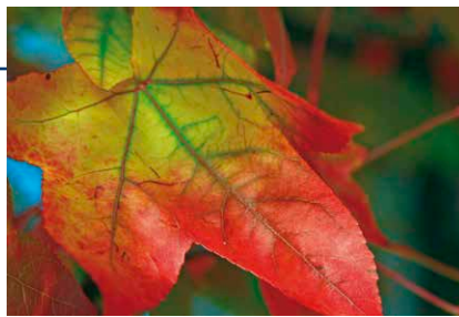
Im Herbst färbt sich das Laub der Blätter in viele Farben.

Die Buntfärbung des Laubs im Herbst gehört zur Vorbereitung der Bäume auf den Winter. Im Frühling und im Sommer nehmen wir vor allem den grünen Farbstoff der Blätter wahr, der im Chlorophyll steckt. Dieser Stoff versorgt den Baum durch die Photosynthese mit Sauerstoff. Bevor im Winter der Frost kommt, leitet der Baum seine Chlorophyllreserven in die Wurzeln und den Stamm, wo es überwintert, um im Frühjahr neue Energie zu spenden.