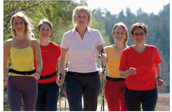
Sportliche Aktivitäten tragen dazu bei, die Wechseljahresbeschwerden in Zaum zu halten.

Da das Klimakterium ein natürlicher Vorgang ist, bedarf es keiner Behandlung, sofern keine stärkeren Beschwerden auftreten. Ist dies jedoch der Fall, ist dem niemand hilflos ausgeliefert. Bis vor 20 Jahren galt die Behandlung mit synthetischen Östrogenen oder einer Kombination von Östrogen und Gestagen als Standard. Die Hormone gaukeln der Hypophyse vor, dass der Östrogenspiegel ausgeglichen und damit keine Stimulierung der Eierstö-