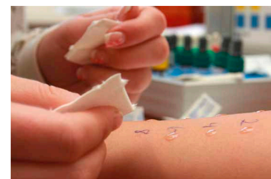
Beim Pricktest werden verschiedene allergene Flüssigkeiten auf die angeritzte Haut aufgetropft. Bilden sich Quaddeln oder rötet sich die Haut, kann der Arzt die Allergie erkennen.

Mit speziellen Hauttests, so genannten Prick- oder Scratchtests, findet der Hautarzt heraus, welche Pollen die allergischen Symptome auslösen. Winzige